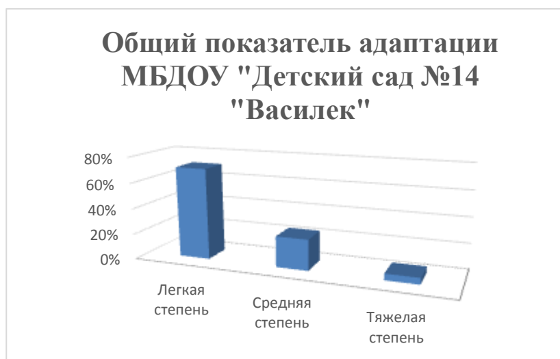
Диаграмма № 1