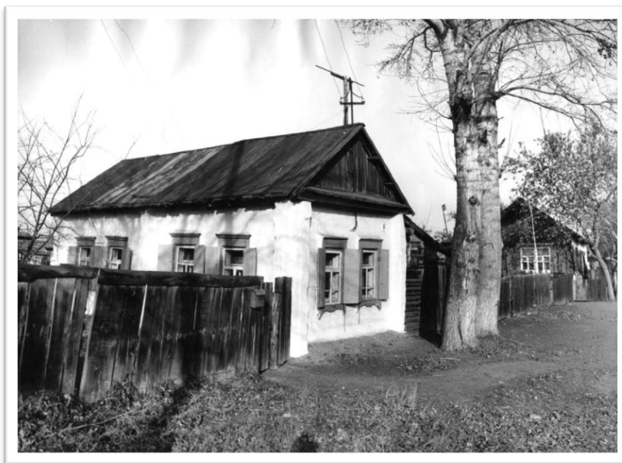
Дом Михаила Рубцова