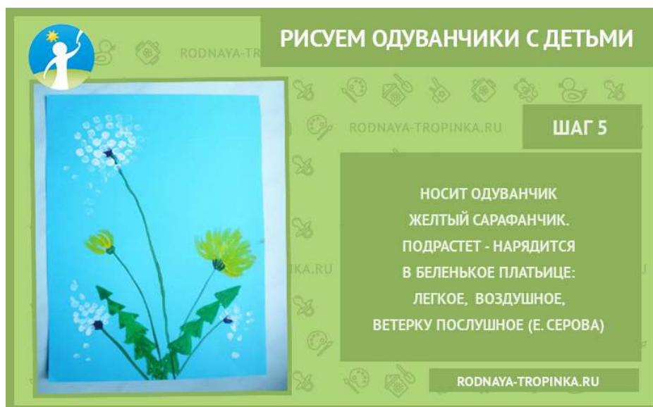
Рисунок готов! Хорошего всем лета! Несмотря на то что во многих регионах оно в этом году холодное, дождливое, нас могут порадовать рисунки с такими солнечными цветами! Удачи вам в творчестве и хорошего летнего отдыха!

Слегка обмакнуть противоположную сторону палочки в желтую краску и легким нажимом на неё нарисовать желтые лепестки одуванчика. Движение палочки идет от сердцевины с нажимом и постепенным отрывом.