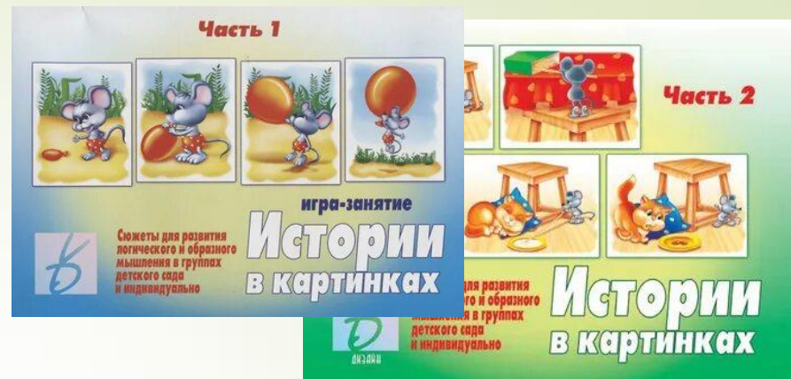
«Истории в картинках»