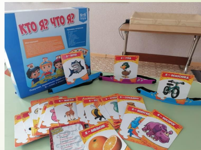
«Кто я?, Что Я?»