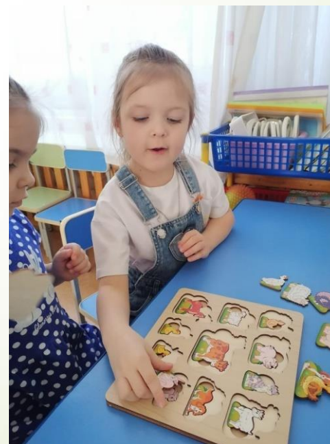
Игра – рамка «Чей малыш? Домашние животные»