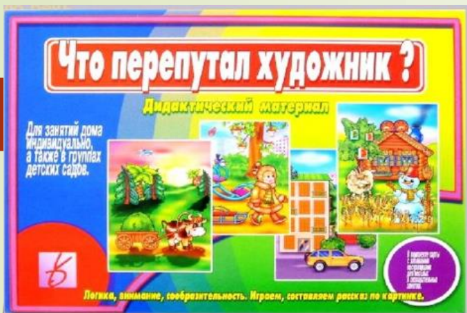
«Что перепутал художник»