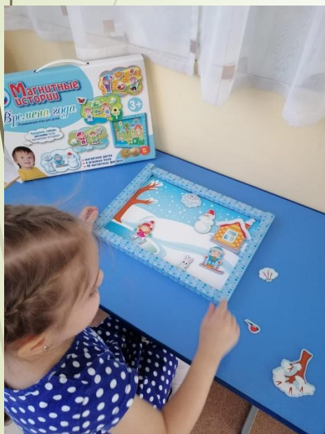
Магнитные истории «Времена года»