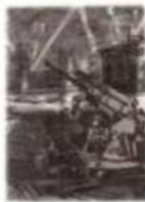
Бомбежка, авианалет, блокада