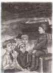
Дети и война