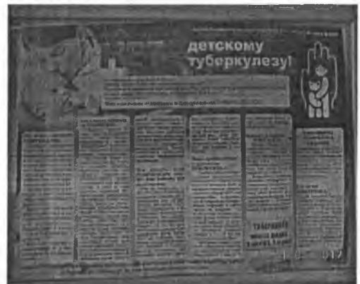
Памятки «Нет – детскому туберкулезу»