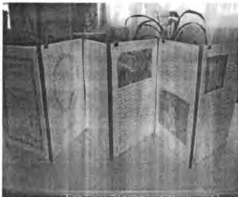
Папка – передвижка «Родителям о туберкулезе»