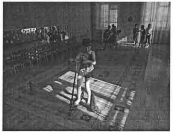
Спортивный досуг «День здоровья».