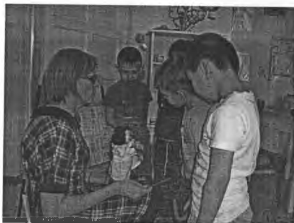
Беседа с детьми «Как возникают болезни».