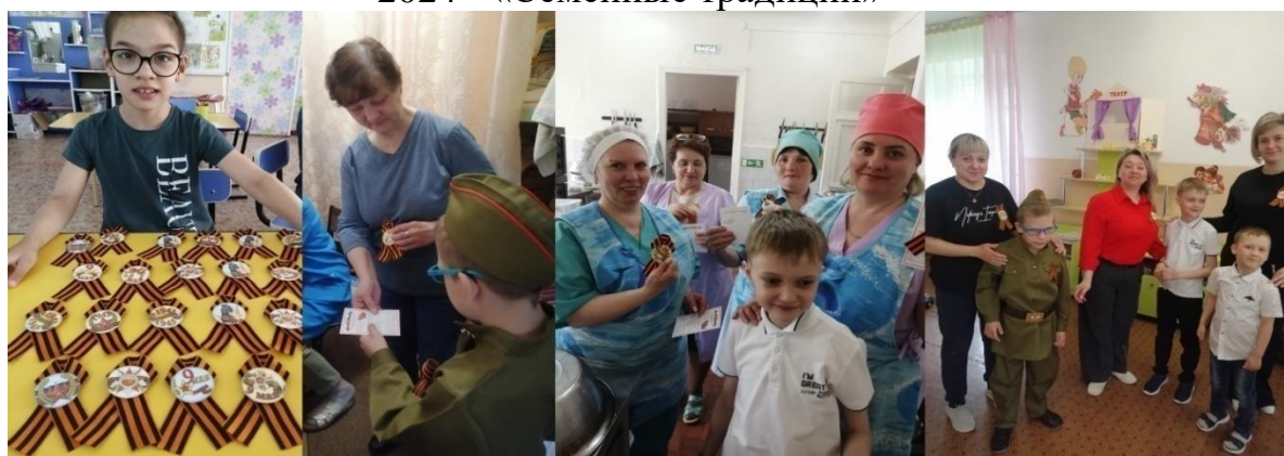
2025 – «Великая победа»

В течение многих лет в детском саду функционирует консультационный пункт «Особый ребёнок» для детей раннего и дошкольного возраста.