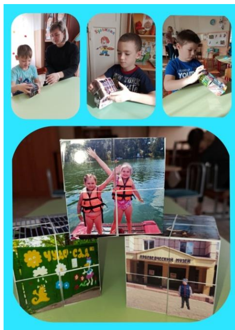
Маршрут выходного дня

Ежегодно проводятся в детском саду фестиваль проектов: